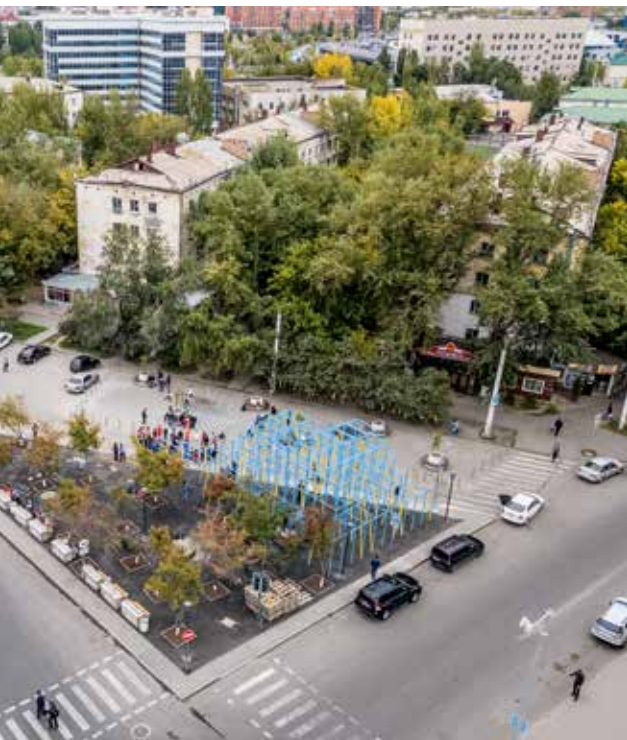
Evgeny Tkachenko (2)